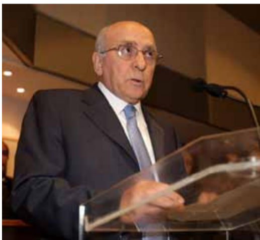
Έφυγε σε ηλικία 85 ετών ο πρώην υπουργός Γιώργος Σουφλιάς σελ. 6

Έκτακτη ρύθμιση 72 δόσεων για ληξιπρόθεσμα χρέη προς το δημόσιο Ποιοι και πώς εντάσσονται σελ. 8