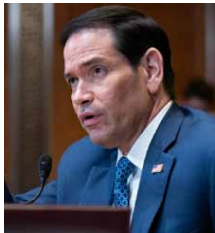
Ρούμπιο: Δεν εξετάζουμε την επανένταξη της Τουρκίας στο πρόγραμμα F-35 σελ. 2