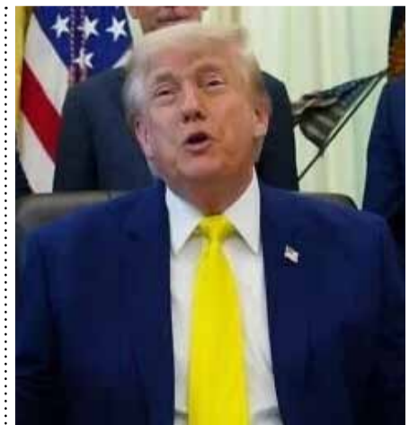
Ο Τραμπ λέει ότι οι ΗΠΑ μπορούν να πάρουν το ουράνιο από το Ιράν χωρίς συμφωνία σελ. 2