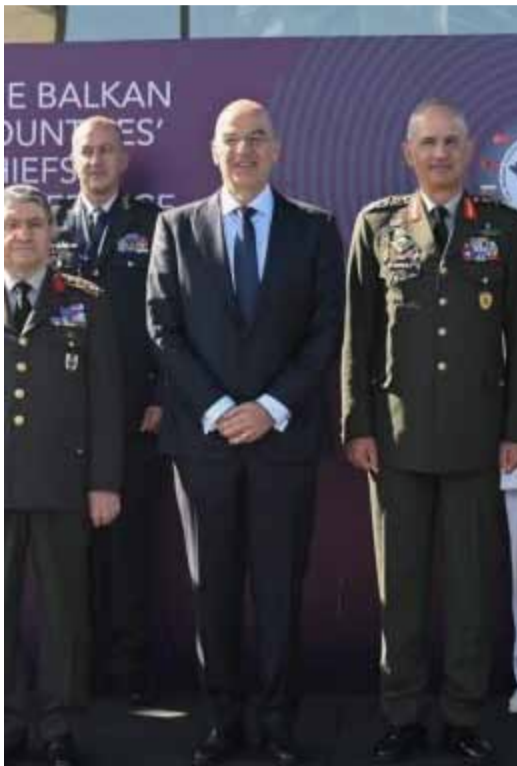
Παρουσία Υπουργού Εθνικής Άμυνας Νίκου Δένδια στη 19η Σύνοδο Αρχηγών Ενόπλων Δυνάμεων των Βαλκανίων σελ. 3