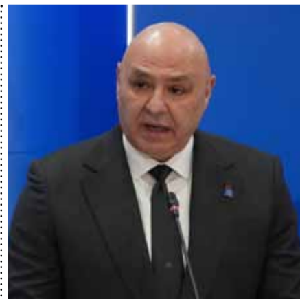
Λιβανέζος πρόεδρος: Το Ιράν χρησιμοποιεί τον Λίβανο ως «διαπραγματευτικό χαρτί» στις συνομιλίες με τις ΗΠΑ σελ. 4