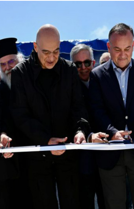
Παρουσία ΥΕΘΑ Ν. Δένδια στα εγκαίνια νέων Στρατιωτικών Οικημάτων στο Αγαθονήσι σελ.3