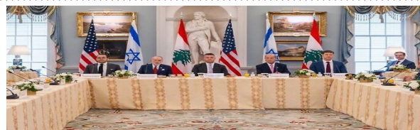
Οι ΗΠΑ ανακοινώνουν 45ήμερη παράταση της εύθραυστης εκεχειρίας στον Λίβανο μετά τον 3ο γύρο συνομιλιών Βηρυτού-Ιερουσαλήμ σελ.4