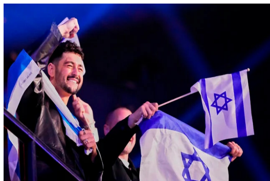
ΘΕΜΑ: Πώς οι New York Times αστόχησαν όσον αφορά το Ισραήλ και τη Eurovision σελ.6