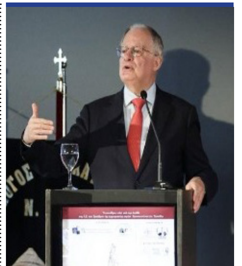
ΠτΔ: Οι προκλήσεις επί του πεδίου είναι πολύ πιο σημαντικές και έχουμε αποδείξει ότι ο Ελληνικός Στρατός έχει την αποτρεπτική δύναμη να τις αποσοβεί